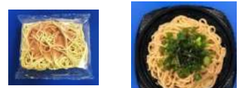
例) きざみネギ、のり