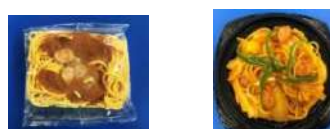
例) 玉ねぎ、ピーマン